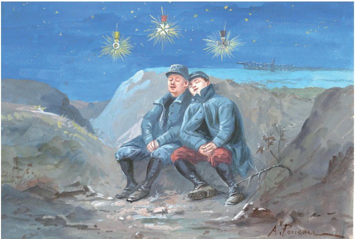
→ Soldats français rêvant dans les tranchées

La superbe galerie des pastels d'Eugène Burnand présente une série de portraits de femmes, de soldats français et d'Alliés qui ont tous participé à la Première Guerre mondiale. Les élèves appréhendent ainsi l'universalité de ce conflit. En 1915, la Croix de guerre est créée afin de récompenser l'héroïsme et le sacrifice des poilus. Elle est la décoration emblématique de la guerre de 1914-1918. Au lendemain de l'armistice, se développe le culte du souvenir. Cet aspect est développé à partir de l'émouvant coffret des Frères Peignot, reliquaire familial à la symbolique très forte, réalisé en 1928.