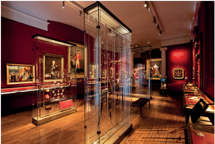
→ Salle de la Légion d'honneur

Créé en 1802 par le Premier consul, l'ordre ne reçoit un insigne qu'en 1804, peu après la proclamation de l'Empire. Bénéficiant d'un grand prestige dès son origine, la Légion d'honneur traverse toutes les vicissitudes de l'histoire de France, pour être toujours aujourd'hui, le premier ordre français. La visite permet de présenter cette longue histoire ponctuée des grandes figures de notre Histoire, avec en point d'orgue, la présentation aux élèves du collier du grand maître de l'ordre remis au président de la République lors de son investiture.